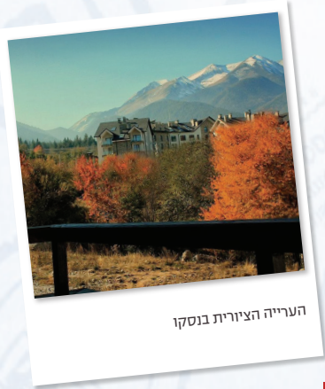
הערייה הציורית בנסקו

23:00 - העברה לאיזור המועדונים. חזרה עצמאית.