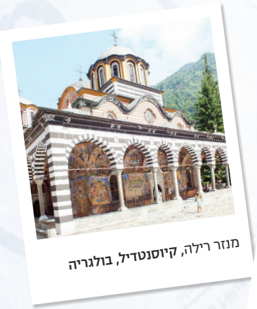
מנזר רילה, קיוסנטדיל, בולגריה