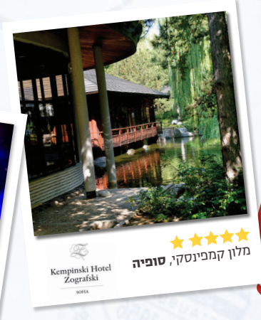
מלון קמפינסקי, סופיה Kempinski Hotel Zografski 5 stars